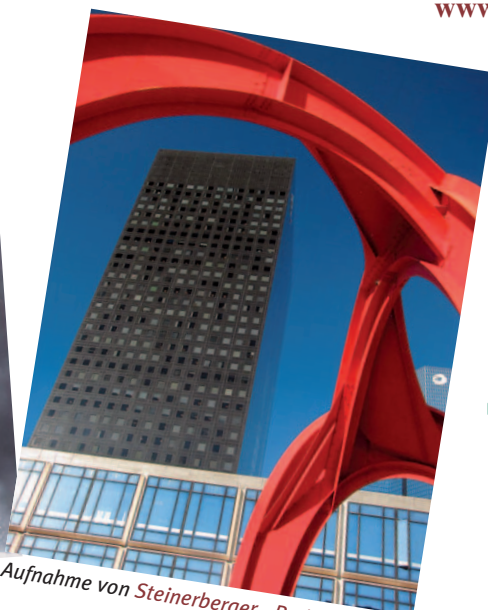
Aufnahme von Steinerberger - Paris